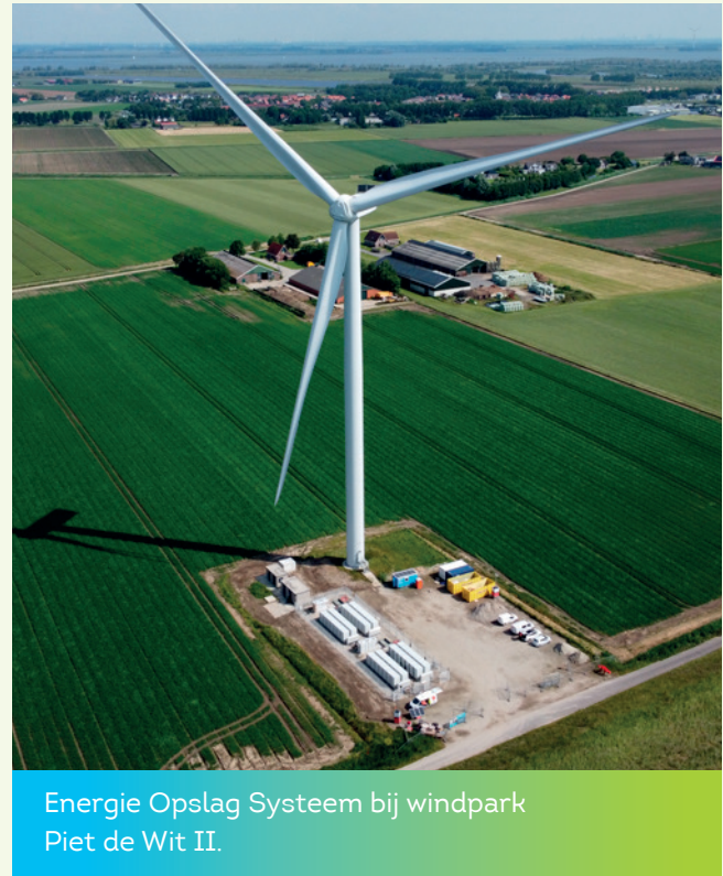
Energie Opslag Systeem bij windpark Piet de Wit II.

Worden jaarlijks ongeveer 15 kennisbijeenkomsten en demonstraties georganiseerd voor akkerbouwers en melkveehouders uit de regio.