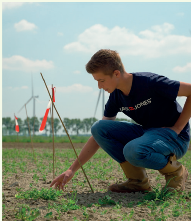
Student aan het werk op één van de proefvelden in de Proeftuin van Pallandtpolder.