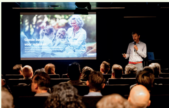
Circulair Bouwsymposium 20 september 2024.

En delen we inspiratieverhalen en video's over wat onze ondernemers al doen om circulair te ondernemen.